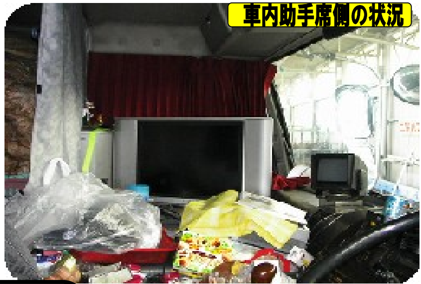
車内助手席側の状況