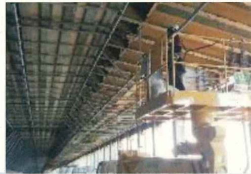
洞門内の梁部材補修状況