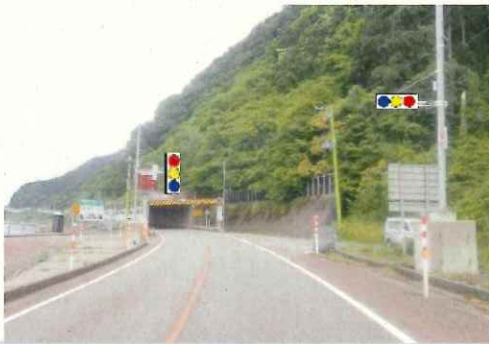
信号規制箇所イメージ