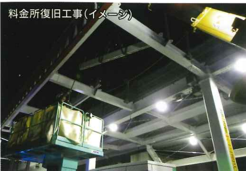
料金所復旧工事(イメージ)