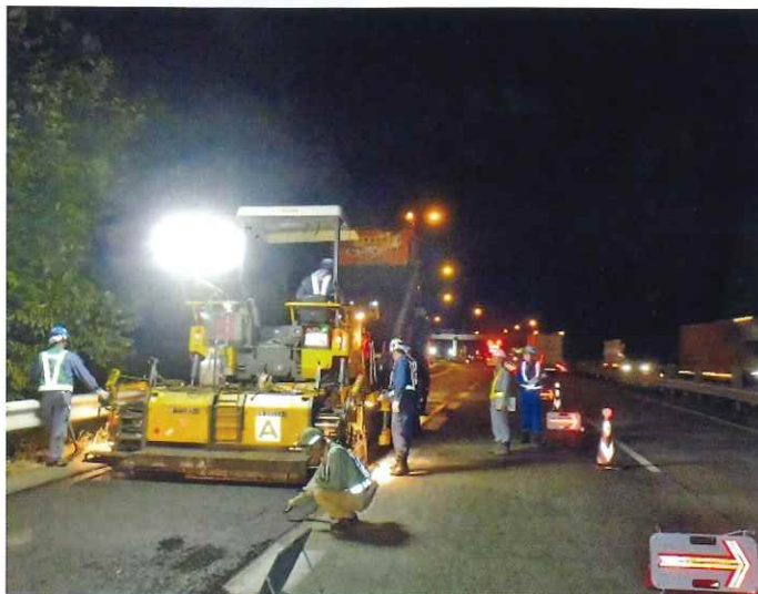
〈舗装補修工事(イメージ)〉

高速道路をご利用のお客さまや沿道の皆さまには、ご不便、ご迷惑をおかけしますが、工事へのご理解・ご協力をお願いいたします。また、ご出発前には最新の交通情報をご確認のうえ、計画的にお出かけいただきますようお願いいたします。