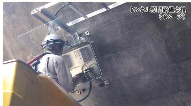
トンネル照明設備点検 (イメージ)