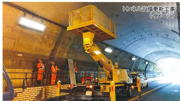
トンネル設備更新工事 (イメージ)

お客さまに高速道路を安全で快適にご利用いただけるよう、 E29 播磨自動車道「播磨JCT～宍粟JCT間」において、トンネル設備更新工事や伐採・清掃等の維持修繕工事及び構造物点検を行います。