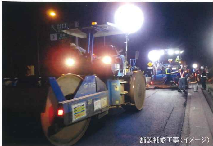
舗装補修工事(イメージ)

工事実施期間中はご不便とご迷惑をおかけいたしますが、何卒、ご理解とご協力をお願いいたします。