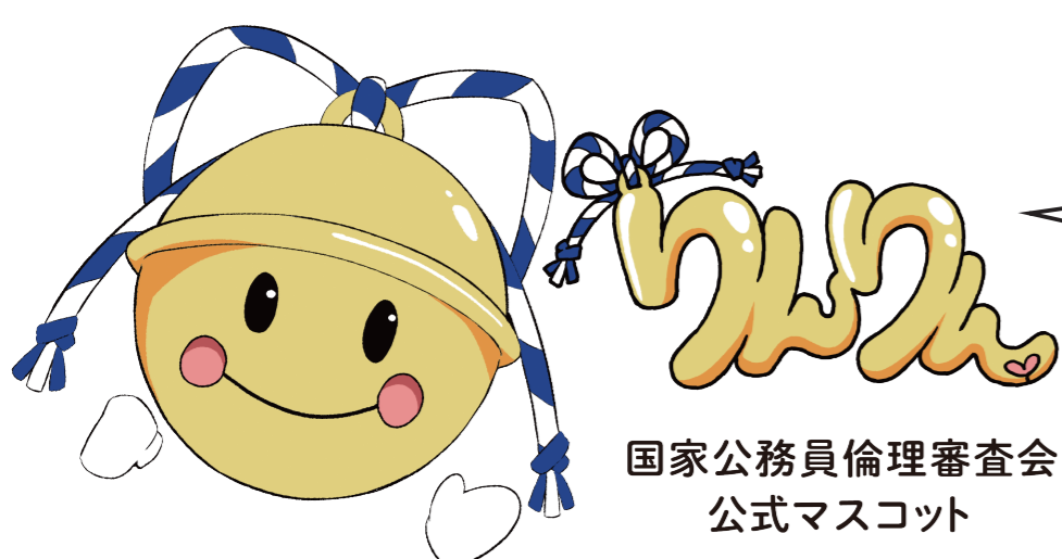
国家公務員倫理審査会 公式マスコット