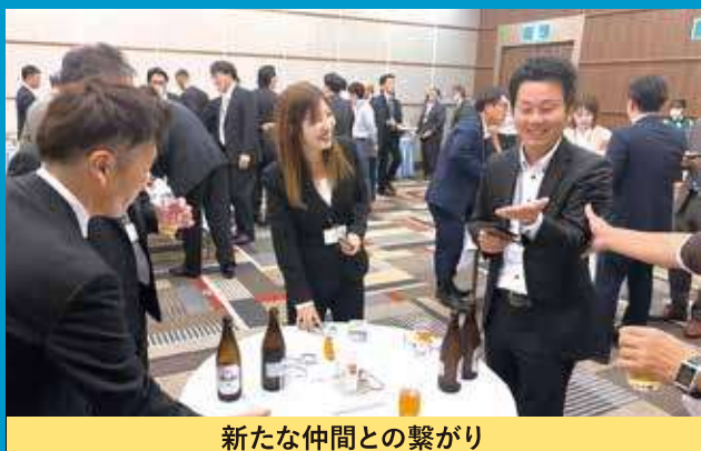
新たな仲間との繋がり