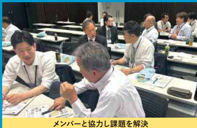
メンバーと協力し課題を解決