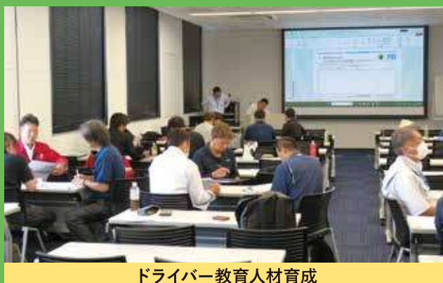
ドライバー教育人材育成