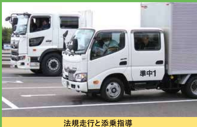
法規走行と添乗指導

https://ssl.aitokyo.jp/chubu_center/nintei-kouza/