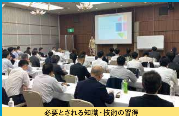
必要とされる知識・技術の習得