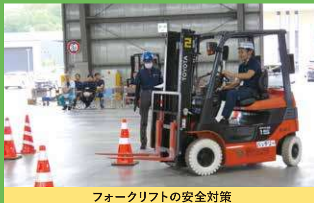
フォークリフトの安全対策