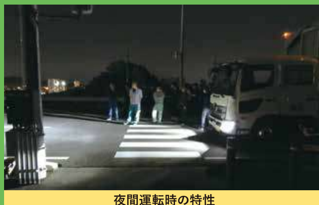
夜間運転時の特性