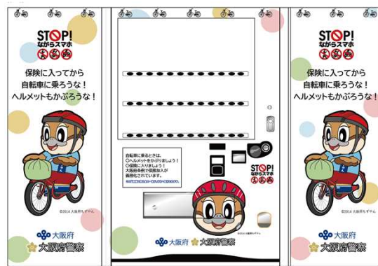
ヘルメット着用啓発 (もずやんデザイン)