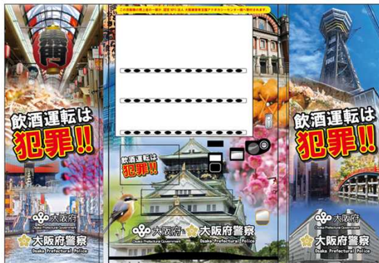
飲酒運転撲滅 (大阪府観光名所デザイン)