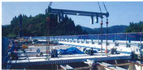
プレストレストコンクリート床版架設

損傷した鉄筋コンクリート床版を、より耐久性の高い床版に取り替えます。 (プレストレストコンクリート床版)