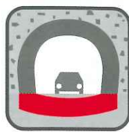
トンネル (インバート設置)

山の性質が悪く、経過年数の増加に伴い過度な力がかかっているトンネルを、リング状のより強い構造とすることで安定性を向上させます。